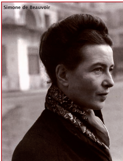
Simone de Beauvoir

Mit Engels, de Beauvoirs und ihrer Gesinnungsgenossen Parolen im Hinterkopf wurde die freie, - weil ohne amtlichen Trauschein und daher jederzeit ohne behördliche Einmischung aufzulösende - Liebe das neue, die elterliche Tradition revolutionierende Familienersatzmodell der vermeintlich besseren Gesellschaft. Wer „zwei Mal mit derselben/demselben pennt, gehört schon zum Establishment“, geriet zum Credo der neuen Freiheitskämpfer/innen, die auch vor Kindern nicht Halt machten.