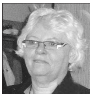
Die Polizei sucht nach der vermissten Frau.

Bei einer weiteren Übernachtung in Genf war der 65-Jährige nach bisherigen Erkenntnissen bereits allein, bevor er mit seinem Firmenwagen nach Südfrankreich weitergefahren war. Einer französischen Ermittlungsrichterin habe der Mann gesagt: »Wir sind nach Stuttgart gefahren.« Dies stütze die Aussage des Hotelmitarbeiters und widerspreche seiner Selbstmord-Version, sagte Kumpa. Die Mordkommission »Rhône« weitete ihre Ermittlungen auf Süddeutschland, die Schweiz, Österreich und Nordfrankreich aus. »Wir stufen die Aussage des Hotelangestellten als glaubwürdig ein«, betonte Kumpa. Die Düsseldorf