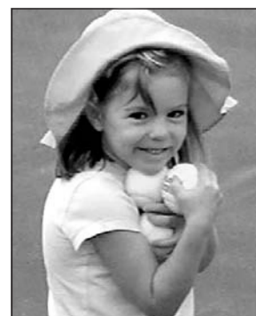
Madeleine McCann wird seit zwei Jahren vermisst.

Nach Medienangaben hatte ein Paar, das in Portugal Urlaub